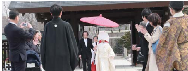
その後 お父様から新婦様の手を新郎様へ