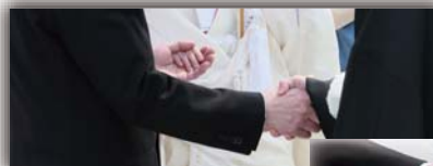
とても印象に残る時間です